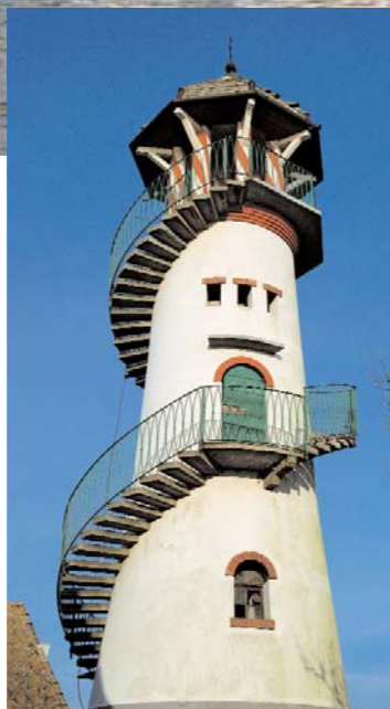
A p. 12: Pietro Longhi, Caccia in Valle, 1760 ca., Venezia, Fondazione Querini Stampalia. In questa pagina: il casone di Valle Zappa, unico nel suo genere, riedificato nel 1925 in stile nordico. Nei dettagli, la lapide in memoria di Ettore Arrigoni Degli Oddi, e la torretta di avvistamento. Nella pagina a fianco: un'opera di tassidermia contemporanea.

ciatori, ma anche per le loro abitudini goliardiche: «Toccata terra cominciano le preoccupazioni, dall'una all'altra finestra è un accorrere sollecito, uno squadrare col cannocchiale tutti gli spazi, per capacitarsi quale sia il luogo preferibile per il domani, un assediare di interrogazione l'oracolo, l'omo de cason, quest'importante personaggio; controllarne con altri il verdetto. Sono un paio d'ore nelle quali la gelosia venatoria ci opprime. Ma essa svanisce del tutto all'allegro desco della sera, dopo il pranzo od al giuoco od alla conversazione, quando lo scilinguagnolo si scioglie nel miraggio delle dorate illusioni. Oh! la caccia del domani. Oh! questi cento colpiti! Questo sogno di rado raggiunto e che domani si compirà; mentre domani alla stessa tavola, alla stessa ora si lambiccheranno i cervelli per giustificare l'insuccesso, dandone colpa a tutto, fuorché ai veri colpevoli: l'occhio ed il braccio del tiratore».