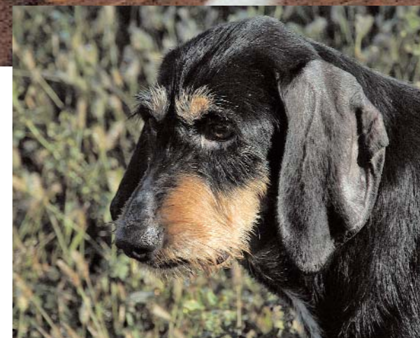
A p. 26: un classico spiedo d'uccelli con la polenta che si crogiola in leccarda. A p. 27: il fagiano protagonista dello spiedo a Isola Vicentina (a sinistra), la quaglia invece di quello a Pieve di Soligo (a destra). Nella pagina a fianco: un segugista impegnato in una battuta alla lepre. In questa pagina: una lepre scatta su un campo arato, terreno sul quale, immobile, si mimetizza alla perfezione; un segugio italiano a pelo forte, razza prediletta dai cacciatori veneti.